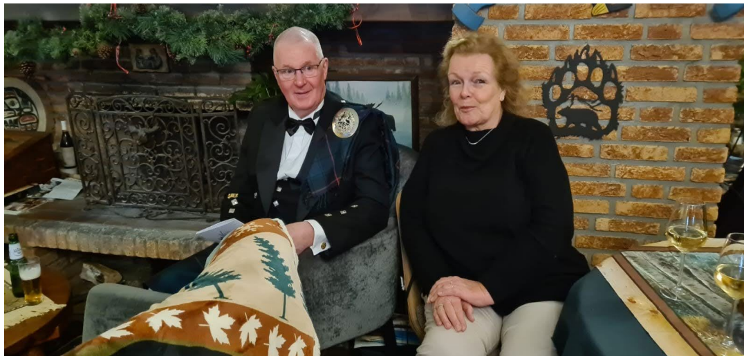
Zoek de verschillen