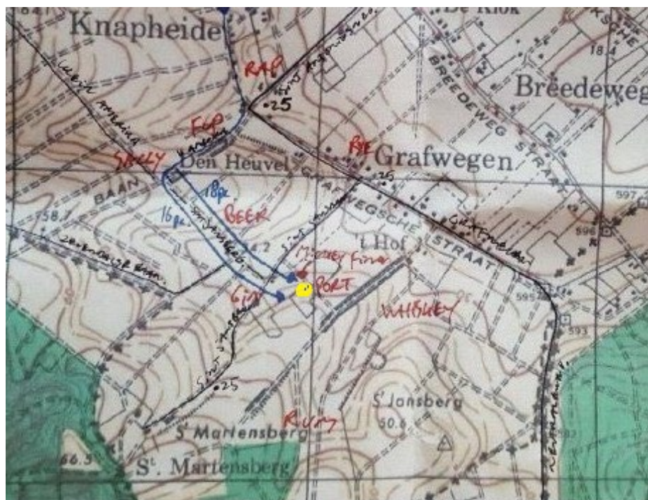
Map: Groesbeek Airborne Vrienden

Uitvoerenden: de D-compagnie van de Black Watch (RHR) of Canada.