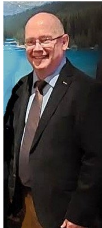
Kolonel @ Canadian Armed Forces