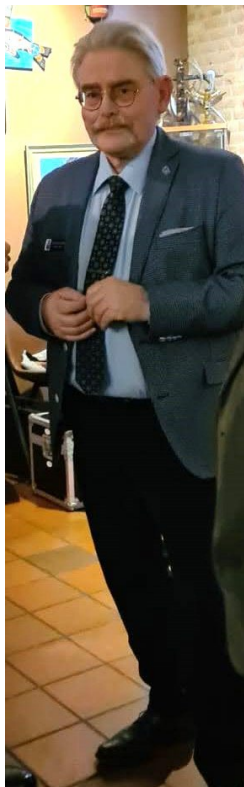
Sergeant @ Arms RCL Branch 005