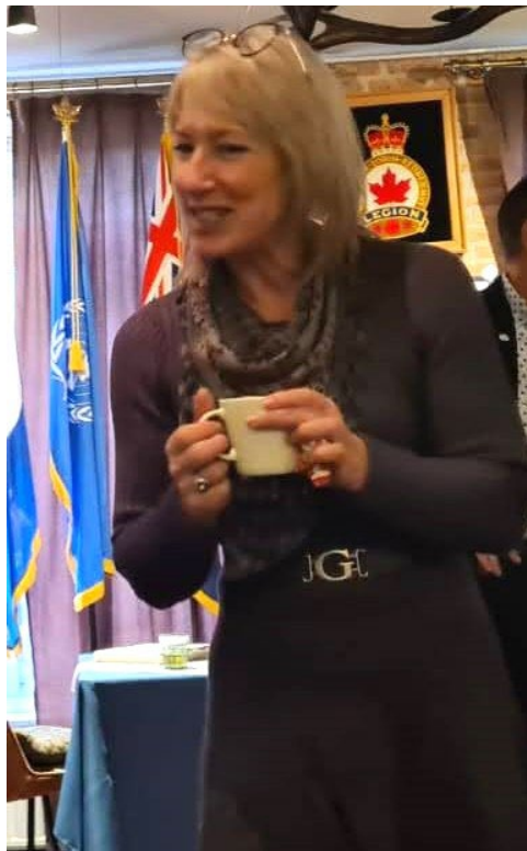
Sergeant @ Royal Canadian Air Force