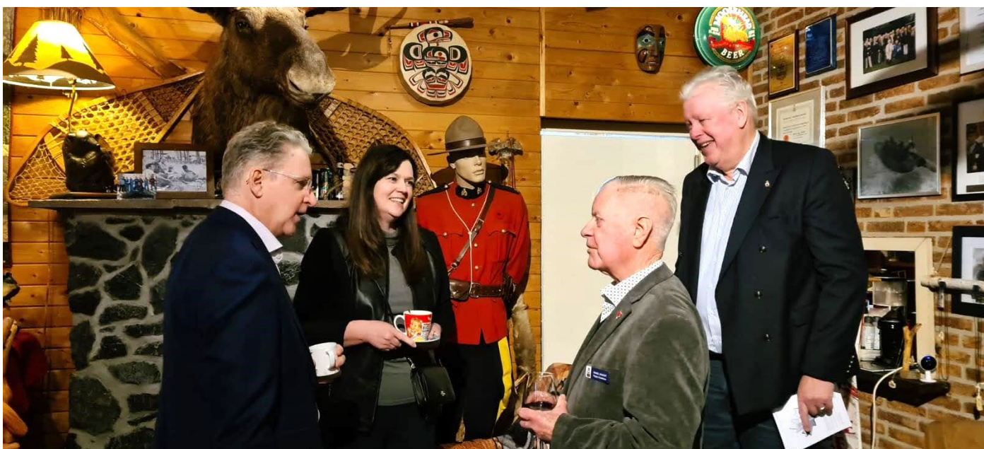
En de "Mounty" zag dat het goed was