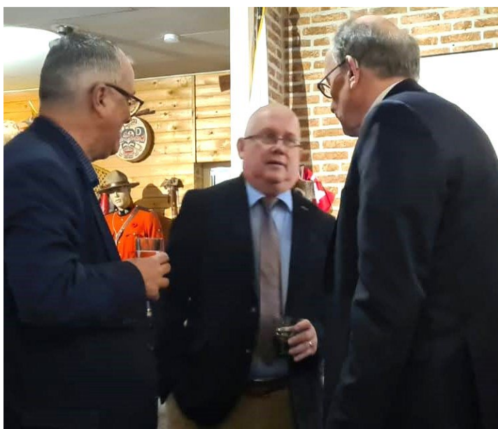
Serius gesprek, zo te zien