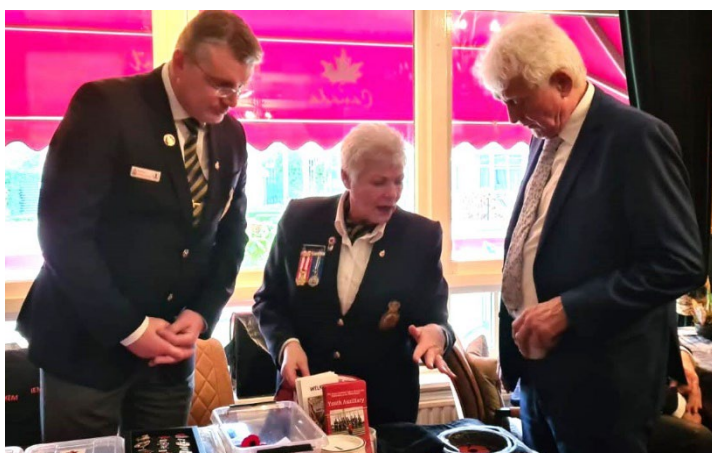
Business as usual door het Kitshop-team