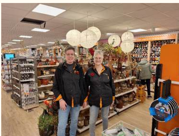
foto's bij Blokker Zelhem en Snackbar Hoogstraat, Hengelo, Gelderland